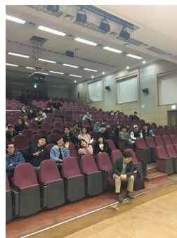
2017년 3월 23일 특강 참석자 인증사진